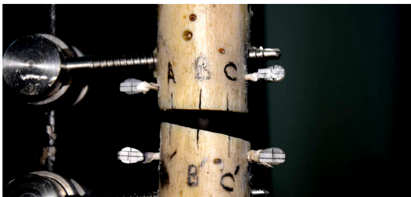
Рис. 1. Зразок великогомілкової кістки з модельованим переломом, закріпленим стержневим апаратом зовнішньої фіксації та з встановленими реперними елементами

Суть цифрового фотографування полягає в наступному. На предметному столі випробувальної машини закріплюють досліджуваний зразок з попередньо встановленими на ньому реперними елементами (рис. 1).